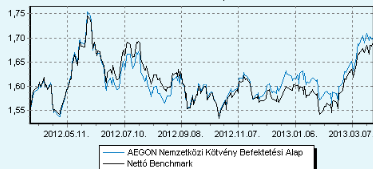
EGY JEGYRE JUTÓ NETTÓ ESZKÖZÉRTÉK, 2012.04.01 - 2013.03.31

Az alapok múltbeli teljesítménye nem nyújt garanciát a jövőbeli hozamok nagyságára. Jelen hirdetés nem minősül ajánlattételnek vagy befektetési tanácsadásnak. A befektetés részletes feltételeit az Alap Tájékoztatója tartalmazza, mely a mindenkor érvényes kondíciós listákkal együtt megtalálható a forgalmazási helyeken. A befektetési alap forgalmazásával (vétel, tartás, eladás) kapcsolatos költségek az alap kezelési szabályzatában és a forgalmazási helyeken megismerhetők.