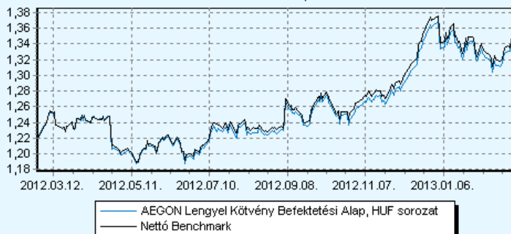
EGY JEGYRE JUTÓ NETTÓ ESZKÖZÉRTÉK, 2012.02.29 - 2013.02.28

Az alapok múltbeli teljesítménye nem nyújt garanciát a jövőbeli hozamok nagyságára. Jelen hirdetés nem minősül ajánlattételnek vagy befektetési tanácsadásnak. A befektetés részletes feltételeit az Alap Tájékoztatója tartalmazza, mely a mindenkor érvényes kondíciós listákkal együtt megtalálható a forgalmazási helyeken. A befektetési alap forgalmazásával (vétel, tartás, eladás) kapcsolatos költségek az alap kezelési szabályzatában és a forgalmazási helyeken megismerhetők.