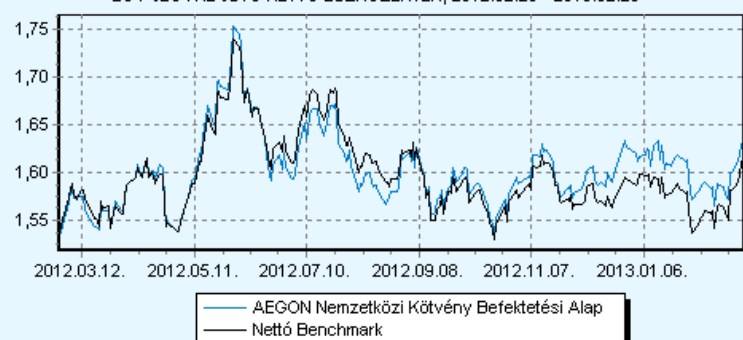
EGY JEGYRE JUTÓ NETTÓ ESZKÖZÉRTÉK, 2012.02.29 - 2013.02.28

Az alapok múltbeli teljesítménye nem nyújt garanciát a jövőbeli hozamok nagyságára. Jelen hirdetés nem minősül ajánlattételnek vagy befektetési tanácsadásnak. A befektetés részletes feltételeit az Alap Tájékoztatója tartalmazza, mely a mindenkor érvényes kondíciós listákkal együtt megtalálható a forgalmazási helyeken. A befektetési alap forgalmazásával (vétel, tartás, eladás) kapcsolatos költségek az alap kezelési szabályzatában és a forgalmazási helyeken megismerhetők.