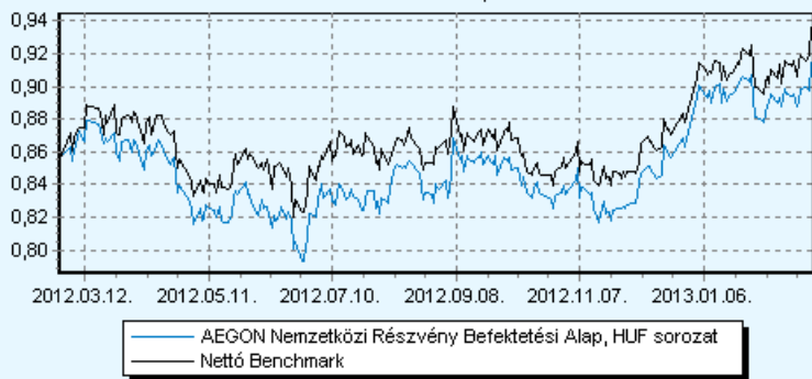
EGY JEGYRE JUTÓ NETTÓ ESZKÖZÉRTÉK, 2012.02.29 - 2013.02.28

Az alapok múltbeli teljesítménye nem nyújt garanciát a jövőbeli hozamok nagyságára. Jelen hirdetés nem minősül ajánlattételnek vagy befektetési tanácsadásnak. A befektetés részletes feltételeit az Alap Tájékoztatója tartalmazza, mely a mindenkor érvényes kondíciós listákkal együtt megtalálható a forgalmazási helyeken. A befektetési alap forgalmazásával (vétel, tartás, eladás) kapcsolatos költségek az alap kezelési szabályzatában és a forgalmazási helyeken megismerhetők.