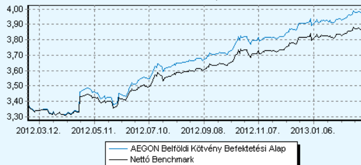
EGY JEGYRE JUTÓ NETTÓ ESZKÖZÉRTÉK, 2012.02.29 - 2013.02.28

Az alapok múltbeli teljesítménye nem nyújt garanciát a jövőbeli hozamok nagyságára. Jelen hirdetés nem minősül ajánlattételnek vagy befektetési tanácsadásnak. A befektetés részletes feltételeit az Alap Tájékoztatója tartalmazza, mely a mindenkor érvényes kondíciós listákkal együtt megtalálható a forgalmazási helyeken. A befektetési alap forgalmazásával (vétel, tartás, eladás) kapcsolatos költségek az alap kezelési szabályzatában és a forgalmazási helyeken megismerhetők.