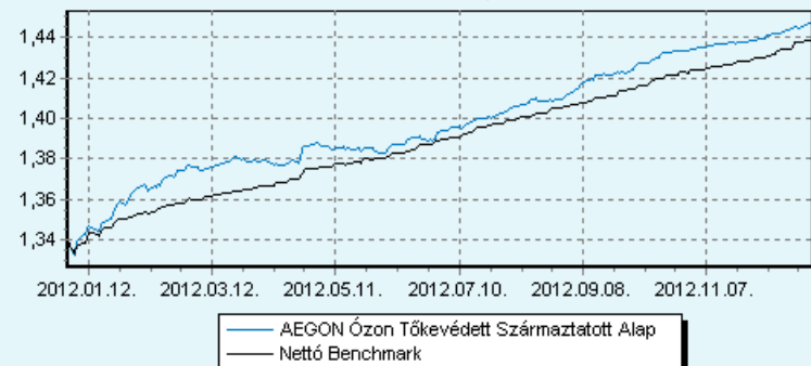
EGY JEGYRE JUTÓ NETTÓ ESZKÖZÉRTÉK, 2012.01.01 - 2012.12.31

Az alapok múltbeli teljesítménye nem nyújt garanciát a jövőbeli hozamok nagyságára. Jelen hirdetés nem minősül ajánlattételnek vagy befektetési tanácsadásnak. A befektetés részletes feltételeit az Alap Tájékoztatója tartalmazza, mely a mindenkor érvényes kondíciós listákkal együtt megtalálható a forgalmazási helyeken. A befektetési alap forgalmazásával (vétel, tartás, eladás) kapcsolatos költségek az alap kezelési szabályzatában és a forgalmazási helyeken megismerhetők.