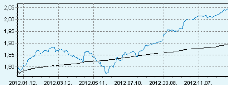
EGY JEGYRE JUTÓ NETTÓ ESZKÖZÉRTÉK, 2012.01.01 - 2012.12.31

Az alapok múltbéli teljesítménye nem nyújt garanciát a jövőbeli hozamok nagyságára. Jelen hirdetés nem minősül ajánlattételnek vagy befektetési tanácsadásnak. A befektetés részletes feltételeit az Alap Tájékoztatója tartalmazza, mely a mindenkor érvényes kondíciós listákkal együtt megtalálható a forgalmazási helyeken. A befektetési alap forgalmazásával (vétel, tartás, eladás) kapcsolatos költségek az alap kezelési szabályzatában és a forgalmazási helyeken megismerhetők.