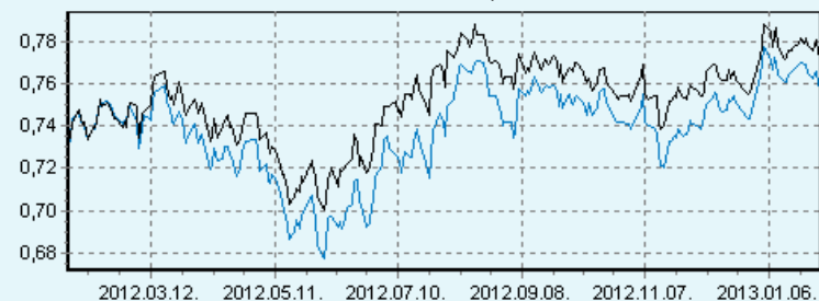
EGY JEGYRE JUTÓ NETTÓ ESZKÖZÉRTÉK, 2012.02.01 - 2013.01.31

Az alapok múltbeli teljesítménye nem nyújt garanciát a jövőbeli hozamok nagyságára. Jelen hirdetés nem minősül ajánlattételnek vagy befektetési tanácsadásnak. A befektetés részletes feltételeit az Alap Tájékoztatója tartalmazza, mely a mindenkor érvényes kondíciók listákkal együtt megtalálható a forgalmazási helyeken. A befektetési alap forgalmazásával (vétel, tartás, eladás) kapcsolatos költségek az alap kezelési szabályzatában és a forgalmazási helyeken megismerhetők.