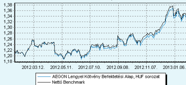
EGY JEGYRE JUTÓ NETTÓ ESZKÖZÉRTÉK, 2012.02.01 - 2013.01.31

Az alapok múltbeli teljesítménye nem nyújt garanciát a jövőbeli hozamok nagyságára. Jelen hirdetés nem minősül ajánlattételnek vagy befektetési tanácsadásnak. A befektetés részletes feltételeit az Alap Tájékoztatója tartalmazza, mely a mindenkor érvényes kondíciós listákkal együtt megtalálható a forgalmazási helyeken. A befektetési alap forgalmazásával (vétel, tartás, eladás) kapcsolatos költségek az alap kezelési szabályzatában és a forgalmazási helyeken megismerhetők.