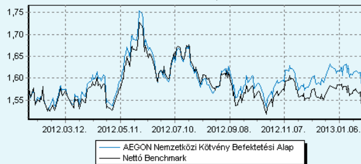
EGY JEGYRE JUTÓ NETTÓ ESZKÖZÉRTÉK, 2012.02.01 - 2013.01.31

Az alapok múltbéli teljesítménye nem nyújt garanciát a jövőbeli hozamok nagyságára. Jelen hirdetés nem minősül ajánlattételnek vagy befektetési tanácsadásnak. A befektetés részletes feltételeit az Alap Tájékoztatója tartalmazza, mely a mindenkor érvényes kondíciós listákkal együtt megtalálható a forgalmazási helyeken. A befektetési alap forgalmazásával (vétel, tartás, eladás) kapcsolatos költségek az alap kezelési szabályzatában és a forgalmazási helyeken megismerhetők.