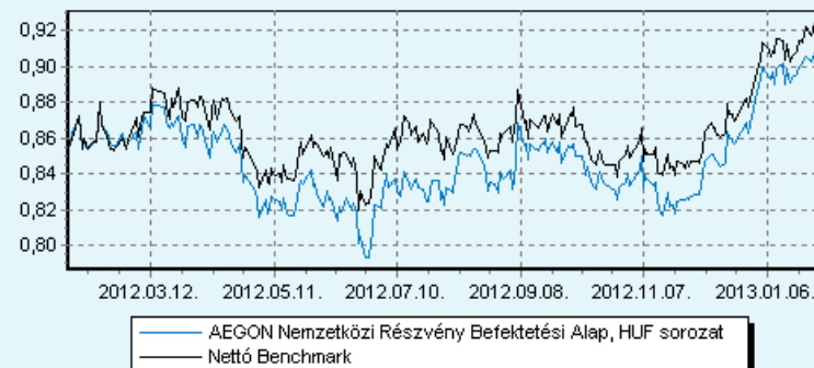
EGY JEGYRE JUTÓ NETTÓ ESZKÖZÉRTÉK, 2012.02.01 - 2013.01.31

Az alapok múltbeli teljesítménye nem nyújt garanciát a jövőbeli hozamok nagyságára. Jelen hirdetés nem minősül ajánlattételnek vagy befektetési tanácsadásnak. A befektetés részletes feltételeit az Alap Tájékoztatója tartalmazza, mely a mindenkor érvényes kondíciós listákkal együtt megtalálható a forgalmazási helyeken. A befektetési alap forgalmazásával (vétel, tartás, eladás) kapcsolatos költségek az alap kezelési szabályzatában és a forgalmazási helyeken megismerhetők.