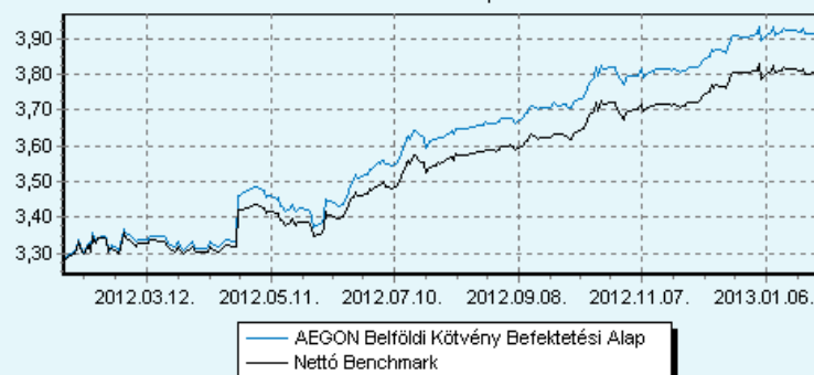
EGY JEGYRE JUTÓ NETTÓ ESZKÖZÉRTÉK, 2012.02.01 - 2013.01.31

Az alapok múltbeli teljesítménye nem nyújt garanciát a jövőbeli hozamok nagyságára. Jelen hirdetés nem minősül ajánlattételnek vagy befektetési tanácsadásnak. A befektetés részletes feltételeit az Alap Tájékoztatója tartalmazza, mely a mindenkor érvényes kondíciós listával együtt megtalálható a forgalmazási helyeken. A befektetési alap forgalmazásával (vétel, tartás, eladás) kapcsolatos költségek az alap kezelési szabályzatában és a forgalmazási helyeken megismerhetők.