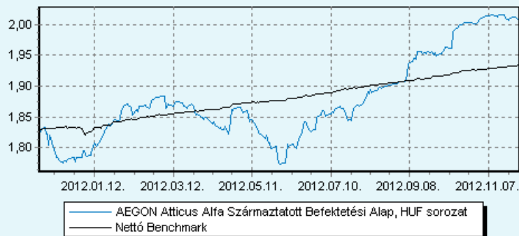
EGY JEGYRE JUTÓ NETTÓ ESZKÖZÉRTÉK, 2011.12.01 - 2012.11.30

Az alapok múltbeli teljesítménye nem nyújt garanciát a jövőbeli hozamok nagyságára. Jelen hirdetés nem minősül ajánlattételnek vagy befektetési tanácsadásnak. A befektetés részletes feltételeit az Alap Tájékoztatója tartalmazza, mely a mindenkor érvényes kondíciós listákkal együtt megtalálható a forgalmazási helyeken. A befektetési alap forgalmazásával (vétel, tartás, eladás) kapcsolatos költségek az alap kezelési szabályzatában és a forgalmazási helyeken megismerhetők.