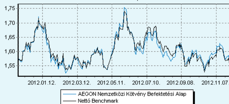
EGY JEGYRE JUTÓ NETTÓ ESZKÖZÉRTÉK, 2011.12.01 - 2012.11.30

Az alapok múltbéli teljesítménye nem nyújt garanciát a jövőbeli hozamok nagyságára. Jelen hirdetés nem minősül ajánlattételnek vagy befektetési tanácsadásnak. A befektetés részletes feltételeit az Alap Tájékoztatója tartalmazza, mely a mindenkor érvényes kondíciós listákkal együtt megtalálható a forgalmazási helyeken. A befektetési alap forgalmazásával (vétel, tartás, eladás) kapcsolatos költségek az alap kezelési szabályzatában és a forgalmazási helyeken megismerhetők.