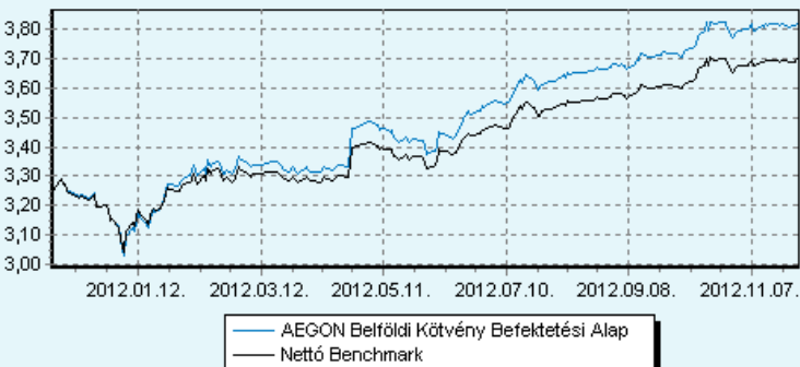
EGY JEGYRE JUTÓ NETTÓ ESZKÖZÉRTÉK, 2011.12.01 - 2012.11.30