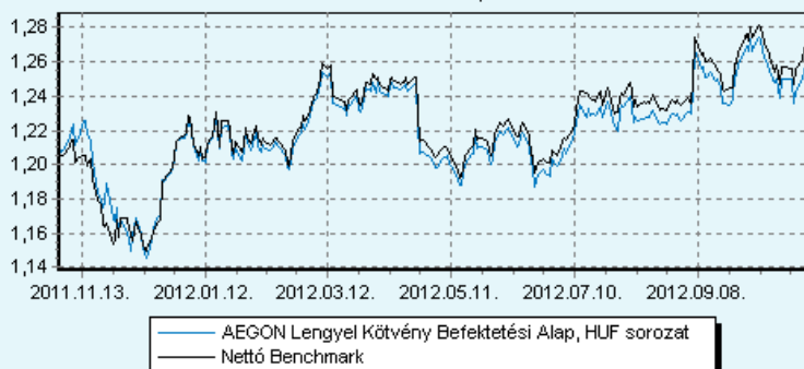
EGY JEGYRE JUTÓ NETTÓ ESZKÖZÉRTÉK, 2011.11.01 - 2012.10.31

Az alapok múltbeli teljesítménye nem nyújt garanciát a jövőbeli hozamok nagyságára. Jelen hirdetés nem minősül ajánlattételnek vagy befektetési tanácsadásnak. A befektetés részletes feltételeit az Alap Tájékoztatója tartalmazza, mely a mindenkor érvényes kondíciós listával együtt megtalálható a forgalmazási helyeken. A befektetési alap forgalmazásával (vétel, tartás, eladás) kapcsolatos költségek az alap kezelési szabályzatában és a forgalmazási helyeken megismerhetők.