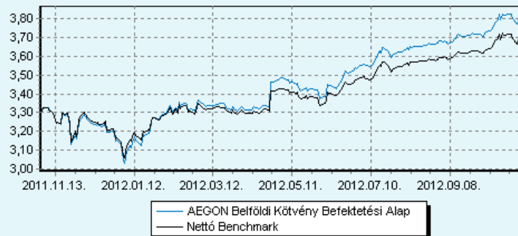
EGY JEGYRE JUTÓ NETTÓ ESZKÖZÉRTÉK, 2011.11.01 - 2012.10.31

Az alapok múltbeli teljesítménye nem nyújt garanciát a jövőbeli hozamok nagyságára. Jelen hirdetés nem minősül ajánlattételnek vagy befektetési tanácsadásnak. A befektetés részletes feltételeit az Alap Tájékoztatója tartalmazza, mely a mindenkor érvényes kondíciós listákkal együtt megtalálható a forgalmazási helyeken. A befektetési alap forgalmazásával (vétel, tartás, eladás) kapcsolatos költségek az alap kezelési szabályzatában és a forgalmazási helyeken megismerhetők.