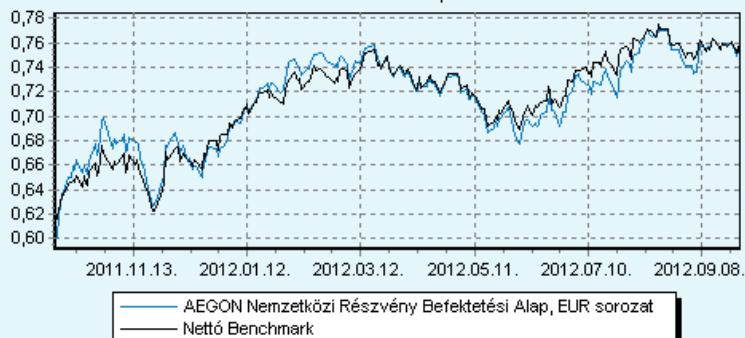
EGY JEGYRE JUTÓ NETTÓ ESZKÖZÉRTÉK, 2011.10.01 - 2012.09.30

Az alapok múltbeli teljesítménye nem nyújt garanciát a jövőbeli hozamok nagyságára. Jelen hirdetés nem minősül ajánlattételnek vagy befektetési tanácsadásnak. A befektetés részletes feltételeit az Alap Tájékoztatója tartalmazza, mely a mindenkor érvényes kondíciók listákkal együtt megtalálható a forgalmazási helyeken. A befektetési alap forgalmazásával (vétel, tartás, eladás) kapcsolatos költségek az alap kezelési szabályzatában és a forgalmazási helyeken megismerhetők.