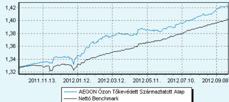
EGY JEGYRE JUTÓ NETTÓ ESZKÖZÉRTÉK, 2011.10.01 - 2012.09.30

Az alapok múltbeli teljesítménye nem nyújt garanciát a jövőbeli hozamok nagyságára. Jelen hirdetés nem minősül ajánlattételnek vagy befektetési tanácsadásnak. A befektetés részletes feltételeit az Alap Tájékoztatója tartalmazza, mely a mindenkor érvényes kondíciós listákkal együtt megtalálható a forgalmazási helyeken. A befektetési alap forgalmazásával (vétel, tartás, eladás) kapcsolatos költségek az alap kezelési szabályzatában és a forgalmazási helyeken megismerhetők.