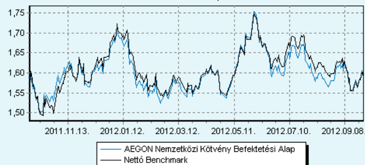
EGY JEGYRE JUTÓ NETTÓ ESZKÖZÉRTÉK, 2011.10.01 - 2012.09.30

Az alapok múltbeli teljesítménye nem nyújt garanciát a jövőbeli hozamok nagyságára. Jelen hirdetés nem minősül ajánlattételnek vagy befektetési tanácsadásnak. A befektetés részletes feltételeit az Alap Tájékoztatója tartalmazza, mely a mindenkor érvényes kondíciós listákkal együtt megtalálható a forgalmazási helyeken. A befektetési alap forgalmazásával (vétel, tartás, eladás) kapcsolatos költségek az alap kezelési szabályzatában és a forgalmazási helyeken megismerhetők.