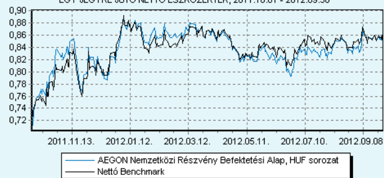
EGY JEGYRE JUTÓ NETTÓ ESZKÖZÉRTÉK, 2011.10.01 - 2012.09.30

Az alapok múltbeli teljesítménye nem nyújt garanciát a jövőbeli hozamok nagyságára. Jelen hirdetés nem minősül ajánlattételnek vagy befektetési tanácsadásnak. A befektetés részletes feltételeit az Alap Tájékoztatója tartalmazza, mely a mindenkor érvényes kondíciós listákkal együtt megtalálható a forgalmazási helyeken. A befektetési alap forgalmazásával (vétel, tartás, eladás) kapcsolatos költségek az alap kezelési szabályzatában és a forgalmazási helyeken megismerhetők.