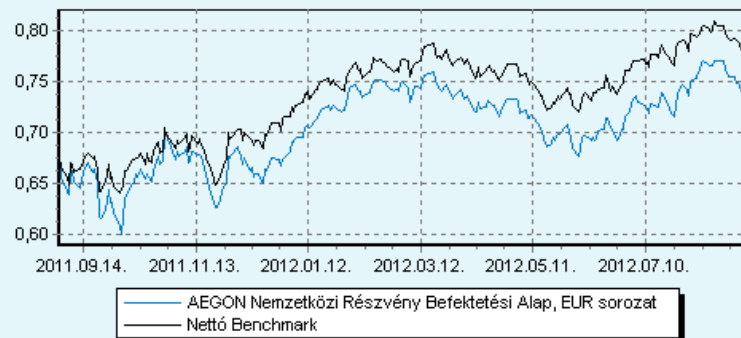
EGY JEGYRE JUTÓ NETTÓ ESZKÖZÉRTÉK, 2011.09.01 - 2012.08.31

Az alapok múltbeli teljesítménye nem nyújt garanciát a jövőbeli hozamok nagyságára. Jelen hirdetés nem minősül ajánlattételnek vagy befektetési tanácsadásnak. A befektetés részletes feltételeit az Alap Tájékoztatója tartalmazza, mely a mindenkor érvényes kondíciós listákkal együtt megtalálható a forgalmazási helyeken. A befektetési alap forgalmazásával (vétel, tartás, eladás) kapcsolatos költségek az alap kezelési szabályzatában és a forgalmazási helyeken megismerhetők.