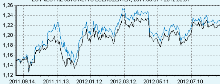
EGY JEGYRE JUTÓ NETTÓ ESZKÖZÉRTÉK, 2011.09.01 - 2012.08.31

— AEGON Lengyel Kötvény Befektetési Alap, HUF sorozat — Nettó Benchmark