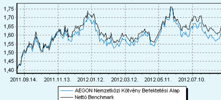
EGY JEGYRE JUTÓ NETTÓ ESZKÖZÉRTÉK, 2011.09.01 - 2012.08.31

Az alapok múltbéli teljesítménye nem nyújt garanciát a jövőbeli hozamok nagyságára. Jelen hirdetés nem minősül ajánlattételnek vagy befektetési tanácsadásnak. A befektetés részletes feltételeit az Alap Tájékoztatója tartalmazza, mely a mindenkor érvényes kondíciós listákkal együtt megtalálható a forgalmazási helyeken. A befektetési alap forgalmazásával (vétel, tartás, eladás) kapcsolatos költségek az alap kezelési szabályzatában és a forgalmazási helyeken megismerhetők.