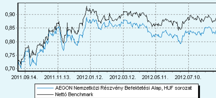
EGY JEGYRE JUTÓ NETTÓ ESZKÖZÉRTÉK, 2011.09.01 - 2012.08.31

Az alapok múltbeli teljesítménye nem nyújt garanciát a jövőbeli hozamok nagyságára. Jelen hirdetés nem minősül ajánlattételnek vagy befektetési tanácsadásnak. A befektetés részletes feltételeit az Alap Tájékoztatója tartalmazza, mely a mindenkor érvényes kondíciós listákkal együtt megtalálható a forgalmazási helyeken. A befektetési alap forgalmazásával (vétel, tartás, eladás) kapcsolatos költségek az alap kezelési szabályzatában és a forgalmazási helyeken megismerhetők.