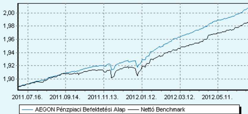
EGY JEGYRE JUTÓ NETTÓ ESZKÖZÉRTÉK, 2011.07.01 - 2012.06.30

Az alapok múltbeli teljesítménye nem nyújt garanciát a jövőbeli hozamok nagyságára. Jelen hirdetés nem minősül ajánlattételnek vagy befektetési tanácsadásnak. A befektetés részletes feltételeit az Alap Tájékoztatója tartalmazza, mely a mindenkor érvényes kondíciós listákkal együtt megtalálható a forgalmazási helyeken. A befektetési alap forgalmazásával (vétel, tartás, eladás) kapcsolatos költségek az alap kezelési szabályzatában és a forgalmazási helyeken megismerhetők.