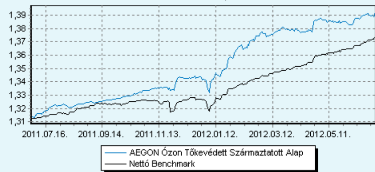
EGY JEGYRE JUTÓ NETTÓ ESZKÖZÉRTÉK, 2011.07.01 - 2012.06.30

Az alapok múltbeli teljesítménye nem nyújt garanciát a jövőbeli hozamok nagyságára. Jelen hirdetés nem minősül ajánlattételnek vagy befektetési tanácsadásnak. A befektetés részletes feltételeit az Alap Tájékoztatója tartalmazza, mely a mindenkor érvényes kondíciós listákkal együtt megtalálható a forgalmazási helyeken. A befektetési alap forgalmazásával (vétel, tartás, eladás) kapcsolatos költségek az alap kezelési szabályzatában és a forgalmazási helyeken megismerhetők.