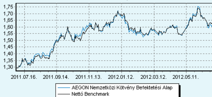
EGY JEGYRE JUTÓ NETTÓ ESZKÖZÉRTÉK, 2011.07.01 - 2012.06.30

Az alapok múltbeli teljesítménye nem nyújt garanciát a jövőbeli hozamok nagyságára. Jelen hirdetés nem minősül ajánlattételnek vagy befektetési tanácsadásnak. A befektetés részletes feltételeit az Alap Tájékoztatója tartalmazza, mely a mindenkor érvényes kondíciós listákkal együtt megtalálható a forgalmazási helyeken. A befektetési alap forgalmazásával (vétel, tartás, eladás) kapcsolatos költségek az alap kezelési szabályzatában és a forgalmazási helyeken megismerhetők.