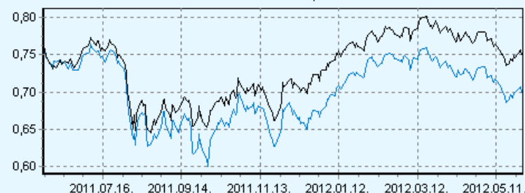
EGY JEGYRE JUTÓ NETTÓ ESZKÖZÉRTÉK, 2011.06.01 - 2012.05.31

Az alapok múltbeli teljesítménye nem nyújt garanciát a jövőbeli hozamok nagyságára. Jelen hirdetés nem minősül ajánlattételnek vagy befektetési tanácsadásnak. A befektetés részletes feltételeit az Alap Tájékoztatója tartalmazza, mely a mindenkor érvényes kondíciós listákkal együtt megtalálható a forgalmazási helyeken. A befektetési alap forgalmazásával (vétel, tartás, eladás) kapcsolatos költségek az alap kezelési szabályzatában és a forgalmazási helyeken megismerhetők.