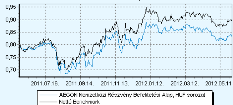
EGY JEGYRE JUTÓ NETTÓ ESZKÖZÉRTÉK, 2011.06.01 - 2012.05.31

Az alapok múltbeli teljesítménye nem nyújt garanciát a jövőbeli hozamok nagyságára. Jelen hirdetés nem minősül ajánlattételnek vagy befektetési tanácsadásnak. A befektetés részletes feltételeit az Alap Tájékoztatója tartalmazza, mely a mindenkor érvényes kondíciós listával együtt megtalálható a forgalmazási helyeken. A befektetési alap forgalmazásával (vétel, tartás, eladás) kapcsolatos költségek az alap kezelési szabályzatában és a forgalmazási helyeken megismerhetők.