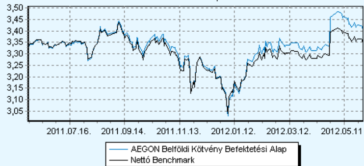
EGY JEGYRE JUTÓ NETTÓ ESZKÖZÉRTÉK, 2011.06.01 - 2012.05.31

Az alapok múltbeli teljesítménye nem nyújt garanciát a jövőbeli hozamok nagyságára. Jelen hirdetés nem minősül ajánlattételnek vagy befektetési tanácsadásnak. A befektetés részletes feltételeit az Alap Tájékoztatója tartalmazza, mely a mindenkor érvényes kondíciós listákkal együtt megtalálható a forgalmazási helyeken. A befektetési alap forgalmazásával (vétel, tartás, eladás) kapcsolatos költségek az alap kezelési szabályzatában és a forgalmazási helyeken megismerhetők.