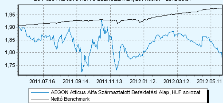
EGY JEGYRE JUTÓ NETTÓ ESZKÖZÉRTÉK, 2011.06.01 - 2012.05.31

Az alapok múltbeli teljesítménye nem nyújt garanciát a jövőbeli hozamok nagyságára. Jelen hirdetés nem minősül ajánlattételnek vagy befektetési tanácsadásnak. A befektetés részletes feltételeit az Alap Tájékoztatója tartalmazza, mely a mindenkor érvényes kondíciós listákkal együtt megtalálható a forgalmazási helyeken. A befektetési alap forgalmazásával (vétel, tartás, eladás) kapcsolatos költségek az alap kezelési szabályzatában és a forgalmazási helyeken megismerhetők.