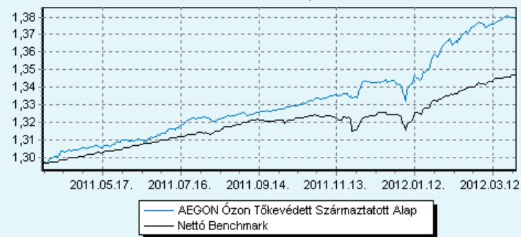
EGY JEGYRE JUTÓ NETTÓ ESZKÖZÉRTÉK, 2011.04.01 - 2012.03.31

Az alapok múltbeli teljesítménye nem nyújt garanciát a jövőbeli hozamok nagyságára. Jelen hirdetés nem minősül ajánlattételnek vagy befektetési tanácsadásnak. A befektetés részletes feltételeit az Alap Tájékoztatója tartalmazza, mely a mindenkor érvényes kondíciók listákkal együtt megtalálható a forgalmazási helyeken. A befektetési alap forgalmazásával (vétel, tartás, eladás) kapcsolatos költségek az alap kezelési szabályzatában és a forgalmazási helyeken megismerhetők.