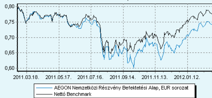
EGY JEGYRE JUTÓ NETTÓ ESZKÖZÉRTÉK, 2011.03.01 - 2012.02.29

Az alapok múltbeli teljesítménye nem nyújt garanciát a jövőbeli hozamok nagyságára. Jelen hirdetés nem minősül ajánlattételnek vagy befektetési tanácsadásnak. A befektetés részletes feltételeit az Alap Tájékoztatója tartalmazza, mely a mindenkor érvényes kondíciós listákkal együtt megtalálható a forgalmazási helyeken. A befektetési alap forgalmazásával (vétel, tartás, eladás) kapcsolatos költségek az alap kezelési szabályzatában és a forgalmazási helyeken megismerhetők.