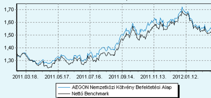
EGY JEGYRE JUTÓ NETTÓ ESZKÖZÉRTÉK, 2011.03.01 - 2012.02.29

Az alapok múltbeli teljesítménye nem nyújt garanciát a jövőbeli hozamok nagyságára. Jelen hirdetés nem minősül ajánlattételnek vagy befektetési tanácsadásnak. A befektetés részletes feltételeit az Alap Tájékoztatója tartalmazza, mely a mindenkor érvényes kondíciós listákkal együtt megtalálható a forgalmazási helyeken. A befektetési alap forgalmazásával (vétel, tartás, eladás) kapcsolatos költségek az alap kezelési szabályzatában és a forgalmazási helyeken megismerhetők.