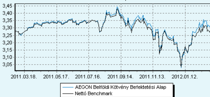
EGY JEGYRE JUTÓ NETTÓ ESZKÖZÉRTÉK, 2011.03.01 - 2012.02.29

Az alapok múltbeli teljesítménye nem nyújt garanciát a jövőbeli hozamok nagyságára. Jelen hirdetés nem minősül ajánlattételnek vagy befektetési tanácsadásnak. A befektetés részletes feltételeit az Alap Tájékoztatója tartalmazza, mely a mindenkor érvényes kondíciós listákkal együtt megtalálható a forgalmazási helyeken. A befektetési alap forgalmazásával (vétel, tartás, eladás) kapcsolatos költségek az alap kezelési szabályzatában és a forgalmazási helyeken megismerhetők.