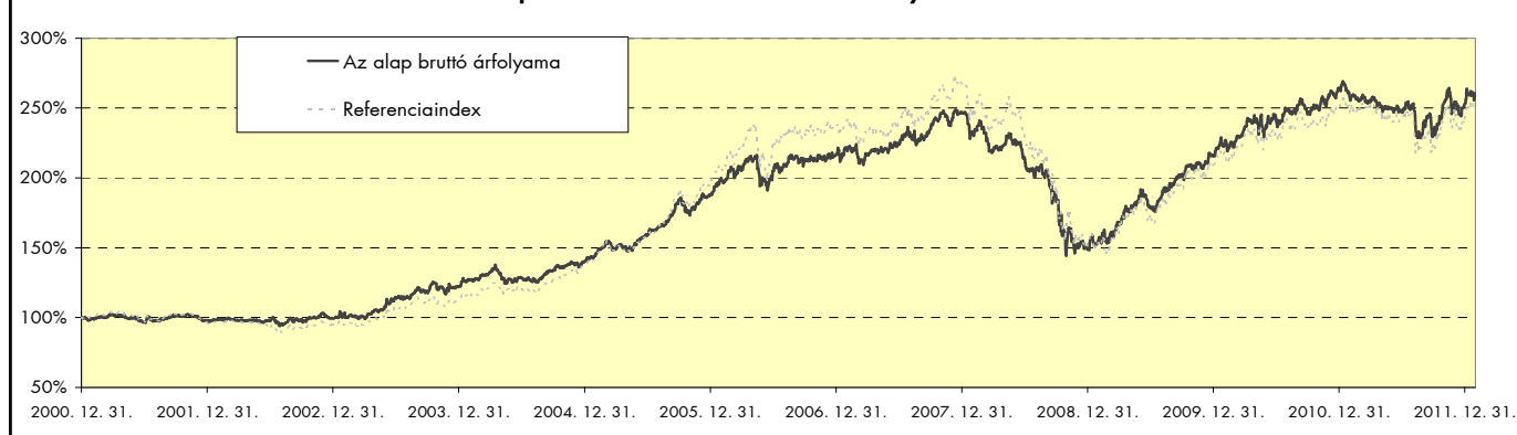
Az alap és referenciaindexének bruttó árfolyama 2001. óta

Mivel a nem kötvénytípusú alapok aránya a portfólióban jelenleg 49,98%, így ennek a feltételnek az alap megfelel.