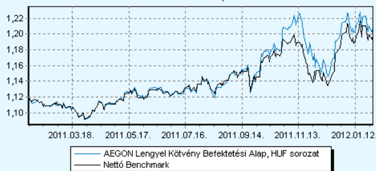
EGY JEGYRE JUTÓ NETTÓ ESZKÖZÉRTÉK, 2011.02.01 - 2012.01.31

Az alapok múltbeli teljesítménye nem nyújt garanciát a jövőbeli hozamok nagyságára. Jelen hirdetés nem minősül ajánlattételnek vagy befektetési tanácsadásnak. A befektetés részletes feltételeit az Alap Tájékoztatója tartalmazza, mely a mindenkor érvényes kondíciós listákkal együtt megtalálható a forgalmazási helyeken. A befektetési alap forgalmazásával (vétel, tartás, eladás) kapcsolatos költségek az alap kezelési szabályzatában és a forgalmazási helyeken megismerhetők.