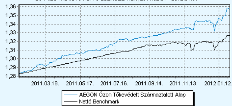
EGY JEGYRE JUTÓ NETTÓ ESZKÖZÉRTÉK, 2011.02.01 - 2012.01.31

Az alapok múltbeli teljesítménye nem nyújt garanciát a jövőbeli hozamok nagyságára. Jelen hirdetés nem minősül ajánlattételnek vagy befektetési tanácsadásnak. A befektetés részletes feltételeit az Alap Tájékoztatója tartalmazza, mely a mindenkor érvényes kondíciós listákkal együtt megtalálható a forgalmazási helyeken. A befektetési alap forgalmazásával (vétel, tartás, eladás) kapcsolatos költségek az alap kezelési szabályzatában és a forgalmazási helyeken megismerhetők.