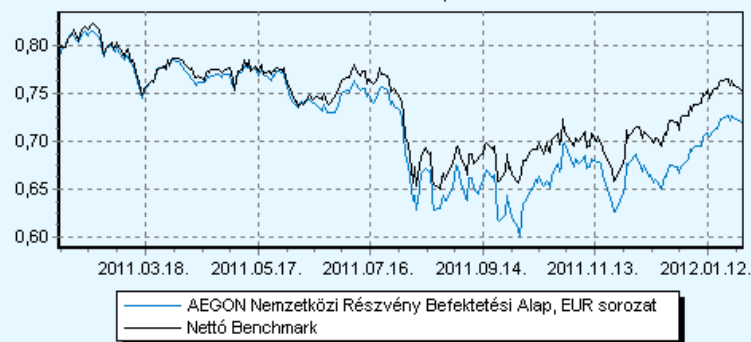
EGY JEGYRE JUTÓ NETTÓ ESZKÖZÉRTÉK, 2011.02.01 - 2012.01.31

Az alapok múltbeli teljesítménye nem nyújt garanciát a jövőbeli hozamok nagyságára. Jelen hirdetés nem minősül ajánlattételnek vagy befektetési tanácsadásnak. A befektetés részletes feltételeit az Alap Tájékoztatója tartalmazza, mely a mindenkor érvényes kondíciós listákkal együtt megtalálható a forgalmazási helyeken. A befektetési alap forgalmazásával (vétel, tartás, eladás) kapcsolatos költségek az alap kezelési szabályzatában és a forgalmazási helyeken megismerhetők.