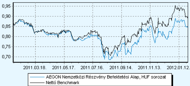
EGY JEGYRE JUTÓ NETTÓ ESZKÖZÉRTÉK, 2011.02.01 - 2012.01.31

Az alapok múltbeli teljesítménye nem nyújt garanciát a jövőbeli hozamok nagyságára. Jelen hirdetés nem minősül ajánlattételnek vagy befektetési tanácsadásnak. A befektetés részletes feltételeit az Alap Tájékoztatója tartalmazza, mely a mindenkor érvényes kondíciós listákkal együtt megtalálható a forgalmazási helyeken. A befektetési alap forgalmazásával (vétel, tartás, eladás) kapcsolatos költségek az alap kezelési szabályzatában és a forgalmazási helyeken megismerhetők.