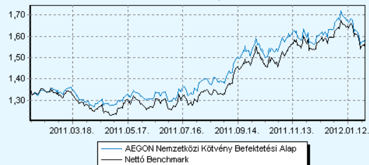
EGY JEGYRE JUTÓ NETTÓ ESZKÖZÉRTÉK, 2011.02.01 - 2012.01.31

Az alapok múltbeli teljesítménye nem nyújt garanciát a jövőbeli hozamok nagyságára. Jelen hirdetés nem minősül ajánlattételnek vagy befektetési tanácsadásnak. A befektetés részletes feltételeit az Alap Tájékoztatója tartalmazza, mely a mindenkor érvényes kondíciós listákkal együtt megtalálható a forgalmazási helyeken. A befektetési alap forgalmazásával (vétel, tartás, eladás) kapcsolatos költségek az alap kezelési szabályzatában és a forgalmazási helyeken megismerhetők.