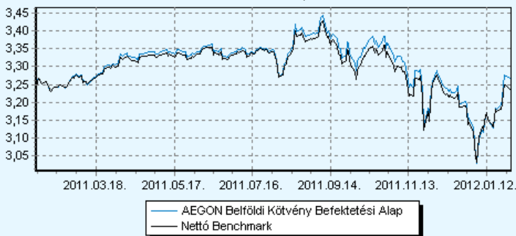
EGY JEGYRE JUTÓ NETTÓ ESZKÖZÉRTÉK, 2011.02.01 - 2012.01.31

Az alapok múltbeli teljesítménye nem nyújt garanciát a jövőbeli hozamok nagyságára. Jelen hirdetés nem minősül ajánlattételnek vagy befektetési tanácsadásnak. A befektetés részletes feltételeit az Alap Tájékoztatója tartalmazza, mely a mindenkor érvényes kondíciós listákkal együtt megtalálható a forgalmazási helyeken. A befektetési alap forgalmazásával (vétel, tartás, eladás) kapcsolatos költségek az alap kezelési szabályzatában és a forgalmazási helyeken megismerhetők.