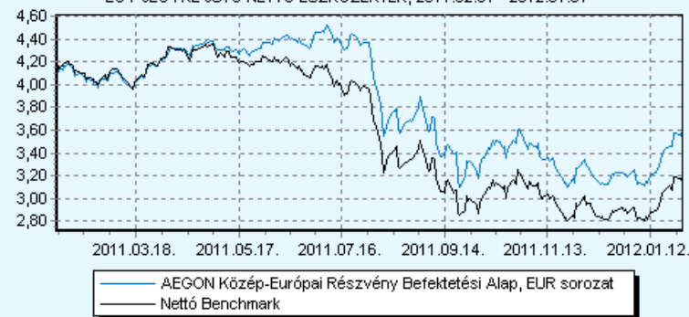
EGY JEGYRE JUTÓ NETTÓ ESZKÖZÉRTÉK, 2011.02.01 - 2012.01.31

Az alapok múltbeli teljesítménye nem nyújt garanciát a jövőbeli hozamok nagyságára. Jelen hirdetés nem minősül ajánlattételnek vagy befektetési tanácsadásnak. A befektetés részletes feltételeit az Alap Tájékoztatója tartalmazza, mely a mindenkor érvényes kondíciós listákkal együtt megtalálható a forgalmazási helyeken. A befektetési alap forgalmazásával (vétel, tartás, eladás) kapcsolatos költségek az alap kezelési szabályzatában és a forgalmazási helyeken megismerhetők.