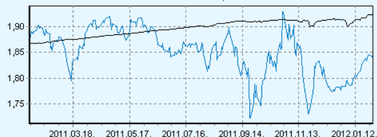
EGY JEGYRE JUTÓ NETTÓ ESZKÖZÉRTÉK, 2011.02.01 - 2012.01.31

Az alapok múltbeli teljesítménye nem nyújt garanciát a jövőbeli hozamok nagyságára. Jelen hirdetés nem minősül ajánlattételnek vagy befektetési tanácsadásnak. A befektetés részletes feltételeit az Alap Tájékoztatója tartalmazza, mely a mindenkor érvényes kondíciós listákkal együtt megtalálható a forgalmazási helyeken. A befektetési alap forgalmazásával (vétel, tartás, eladás) kapcsolatos költségek az alap kezelési szabályzatában és a forgalmazási helyeken megismerhetők.