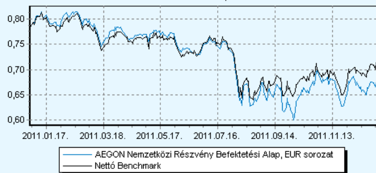
EGY JEGYRE JUTÓ NETTÓ ESZKÖZÉRTÉK, 2011.01.01 - 2011.12.31

Az alapok múltbeli teljesítménye nem nyújt garanciát a jövőbeli hozamok nagyságára. Jelen hirdetés nem minősül ajánlattételnek vagy befektetési tanácsadásnak. A befektetés részletes feltételeit az Alap Tájékoztatója tartalmazza, mely a mindenkor érvényes kondíciós listákkal együtt megtalálható a forgalmazási helyeken. A befektetési alap forgalmazásával (vétel, tartás, eladás) kapcsolatos költségek az alap kezelési szabályzatában és a forgalmazási helyeken megismerhetők.