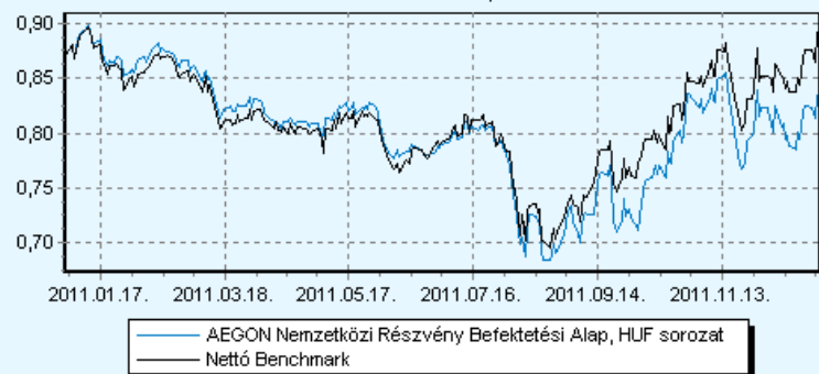
EGY JEGYRE JUTÓ NETTÓ ESZKÖZÉRTÉK, 2011.01.01 - 2011.12.31

Az alapok múltbeli teljesítménye nem nyújt garanciát a jövőbeli hozamok nagyságára. Jelen hirdetés nem minősül ajánlattételnek vagy befektetési tanácsadásnak. A befektetés részletes feltételeit az Alap Tájékoztatója tartalmazza, mely a mindenkor érvényes kondíciós listákkal együtt megtalálható a forgalmazási helyeken. A befektetési alap forgalmazásával (vétel, tartás, eladás) kapcsolatos költségek az alap kezelési szabályzatában és a forgalmazási helyeken megismerhetők.