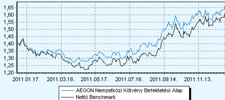
EGY JEGYRE JUTÓ NETTÓ ESZKÖZÉRTÉK, 2011.01.01 - 2011.12.31

Az alapok múltbeli teljesítménye nem nyújt garanciát a jövőbeli hozamok nagyságára. Jelen hirdetés nem minősül ajánlattételnek vagy befektetési tanácsadásnak. A befektetés részletes feltételeit az Alap Tájékoztatója tartalmazza, mely a mindenkor érvényes kondíciós listákkal együtt megtalálható a forgalmazási helyeken. A befektetési alap forgalmazásával (vétel, tartás, eladás) kapcsolatos költségek az alap kezelési szabályzatában és a forgalmazási helyeken megismerhetők.