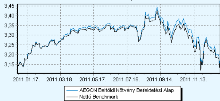
EGY JEGYRE JUTÓ NETTÓ ESZKÖZÉRTÉK, 2011.01.01 - 2011.12.31

Az alapok múltbeli teljesítménye nem nyújt garanciát a jövőbeli hozamok nagyságára. Jelen hirdetés nem minősül ajánlattételnek vagy befektetési tanácsadásnak. A befektetés részletes feltételeit az Alap Tájékoztatója tartalmazza, mely a mindenkor érvényes kondíciós listákkal együtt megtalálható a forgalmazási helyeken. A befektetési alap forgalmazásával (vétel, tartás, eladás) kapcsolatos költségek az alap kezelési szabályzatában és a forgalmazási helyeken megismerhetők.