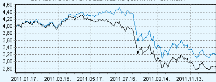
EGY JEGYRE JUTÓ NETTÓ ESZKÖZÉRTÉK, 2011.01.01 - 2011.12.31

Az alapok múltbeli teljesítménye nem nyújt garanciát a jövőbeli hozamok nagyságára. Jelen hirdetés nem minősül ajánlattételnek vagy befektetési tanácsadásnak. A befektetés részletes feltételeit az Alap Tájékoztatója tartalmazza, mely a mindenkor érvényes kondíciós listákkal együtt megtalálható a forgalmazási helyeken. A befektetési alap forgalmazásával (vétel, tartás, eladás) kapcsolatos költségek az alap kezelési szabályzatában és a forgalmazási helyeken megismerhetők.